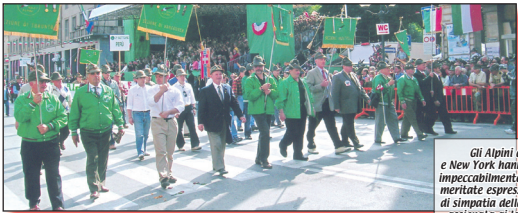
Gli Alpini del Canada e New York hanno potuto sfilare impeccabilmente, raccogliendo le meritate espressioni di affetto e di simpatia della numerosa folla assiepiata ai lati del percorso.