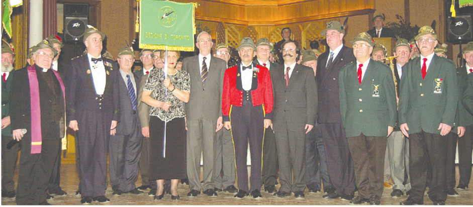
Nella foto gli Alpini con il console generale d'Italia a Toronto Luca Brofferio

A lla 78esima adunata che si tiene a Parma nel 2005 giungono 400mila Alpini e di questi 90mila sfilano ininterrottamente per 10 ore lungo i viali della bella città. È questo il primo raduno nazionale senza più la leva obbligatoria e per l'occasione gli alpini coniano lo slogan "Un alpino ci sarà sempre", slogan condiviso anche dal ministro della Difesa Antonio Martino che dalla tribuna d'onore assiste alla sfilata.